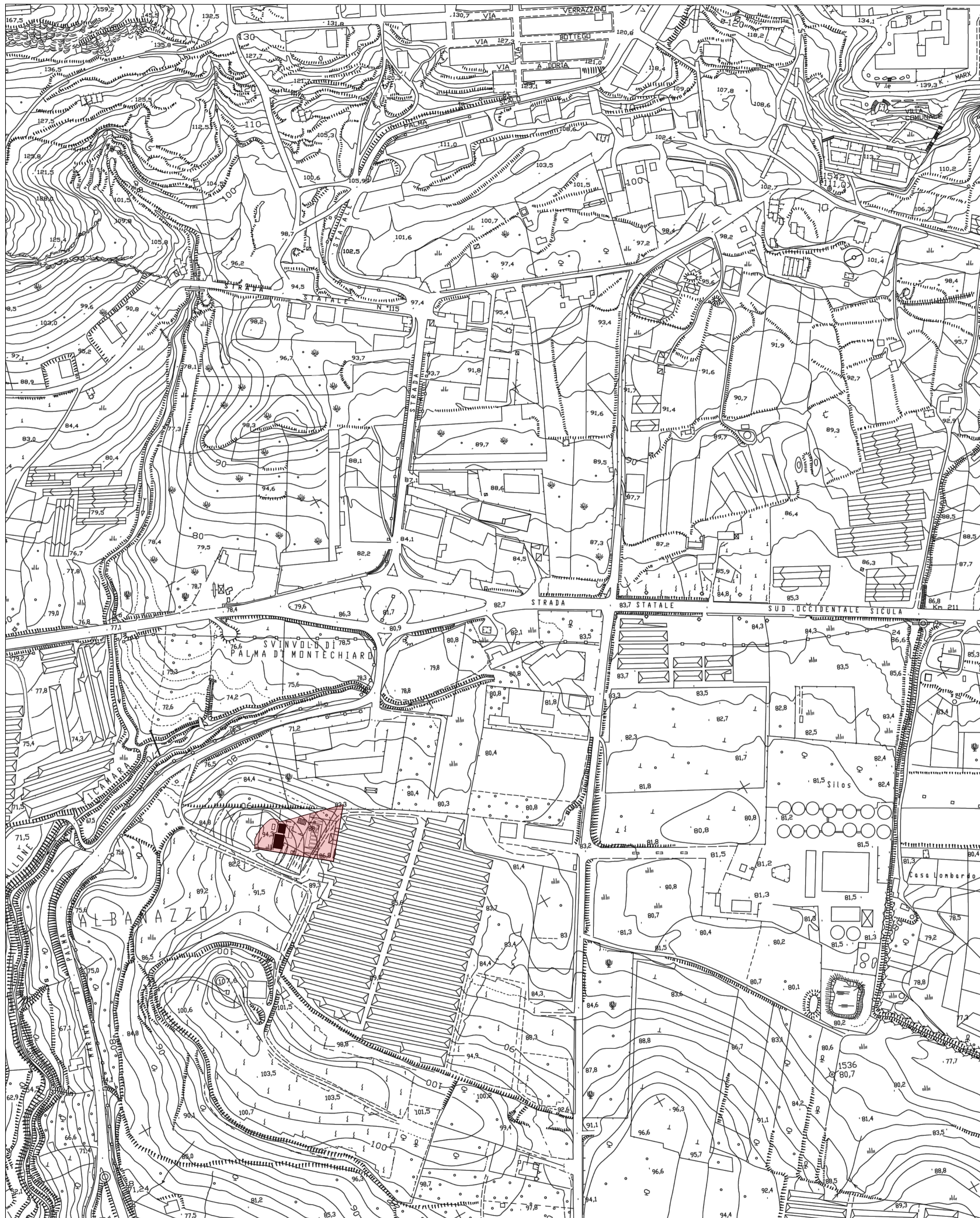
STRALCIO AEROFOTOGRAMMETRICO DI ZONA